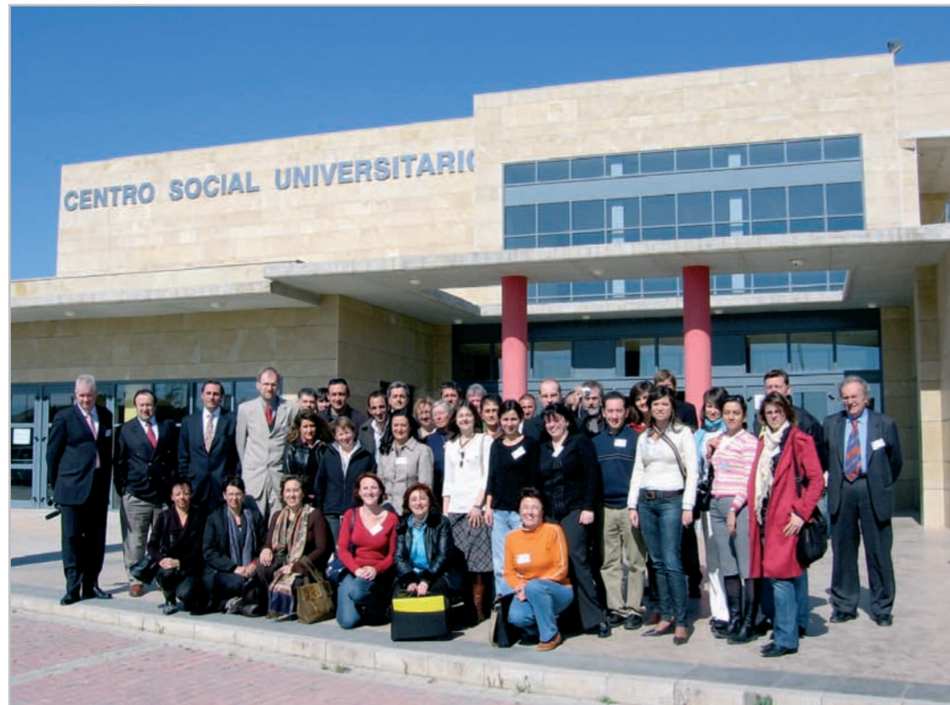
1 ère réunion annuelle, 21-23 mars 2007, Université de Murcie, Espagne

Acronyme : LYCOCARD Contrat n°016213 Début : 01 avril 2006 Site Internet : www.lycocard.com